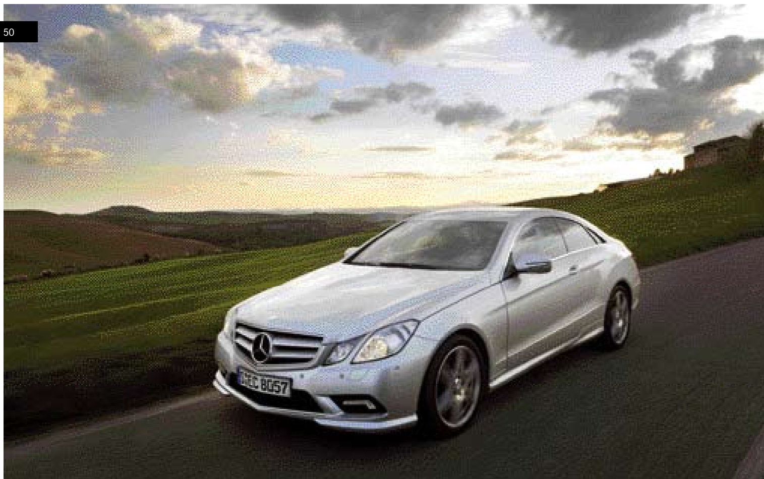
EEN NIEUWE VONDST IS DE 'ATTENTION ASSIST', EEN SYSTEEM DAT DREIGENDE VERMOEDIGHEID BIJ DE BESTUURDER HERKENT

Zoals het een merk met een bepaalde status betaamt, vindt de introductie van de nieuwe E-Klasse plaats in het mooie Toscane, in de buurt van het trekpleisterplaatsje Siena. We zijn aangekomen op een stijlvolle locatie waar de briefing van de Duitse marketingmannen plaatsvindt. Een dertigtal nieuwe E Coupés staat al te schitteren in de zon. 'Welkom thuis', staat op de eerste pagina van de brochure die we van Mercedes ontvangen. Daarmee willen ze de stoïcijnse E-Klasse rijders (en passagiers) een vertrouwd gevoel geven.